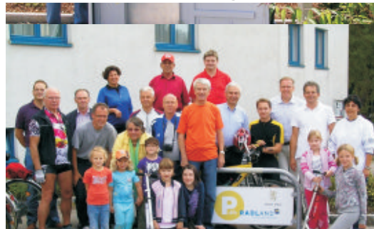
Eröffnung "1. Radparkplatz"