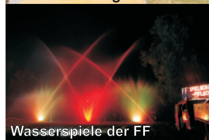
Wasserspiele der FF