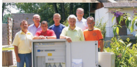
Stromversorgung für Spielplatz