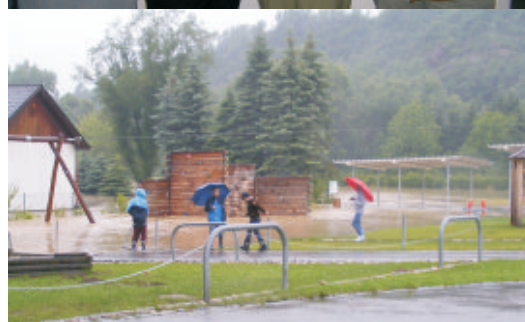
Extremes Pielachhochwasser 2009