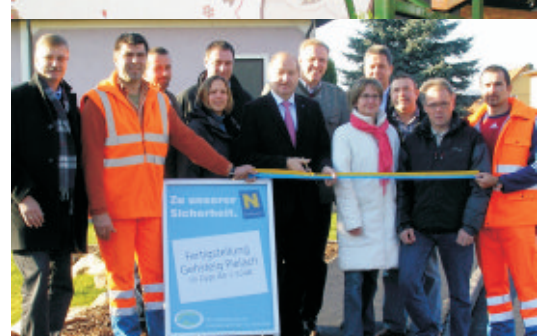
Eröffnung der Gehwege in Pielach

DORFERNEUERUNG SPIELBERG-PIELACH-PIELACHBERG Leben im Dorf - anders?