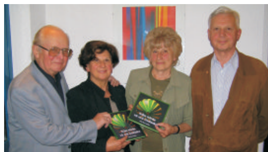
Soziale Lesung im Dorf!