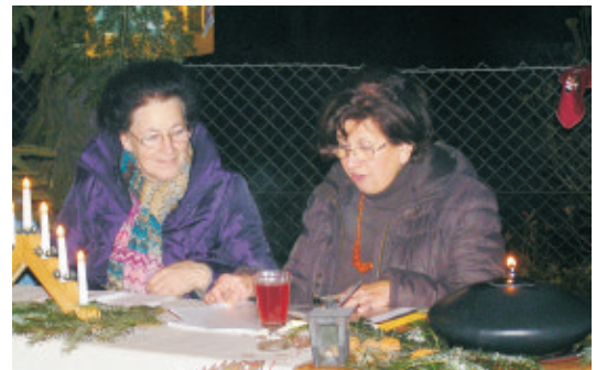
Spielberger Advent 2009