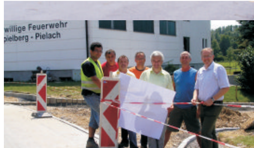
Gehsteigerweiterung und Sanierung